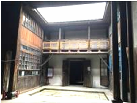
图 17 福州市下杭路 209 号窗扇形式 Fig. 17 Form of window of No. 209 Xiahang Road in Fuzhou

在门窗装修方面,由于建筑材料的更新和发展,玻璃逐步进入中国市场并广泛使用,同时逐步淘汰过去的绵纸、绢、纱、油纸等防水防风糊门窗的用材。门窗亦由我国传统