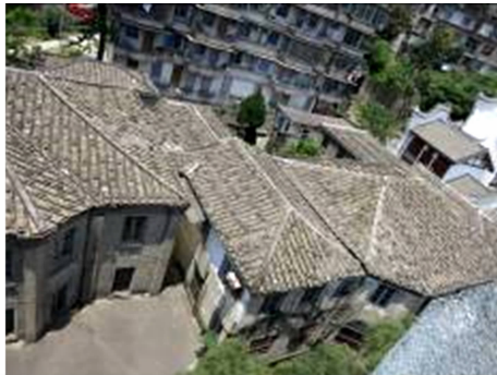
图 14 福州市马尾“圣教医院”屋顶组合形式