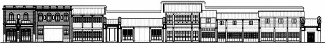
图 1 福州市塔巷 79~101 号立面图 Fig. 1 Elevation of No. 79-101 Ta Lane in Fuzhou

在近代以前,福州传统民居的空间形态一直维持着传统合院式的单层平面空间格局.清道光二十四年(1844 年),福州作为“五口通商”口岸开埠之后,对外开放促进商业繁荣、人口急剧膨胀、城镇用地紧凑,民居的空间形态开始发生显著变化.各种密度较高,且采用紧凑平面布局的联排式住宅 [2-3] ,木造廊式洋楼等新建筑形式相继出现(图 1,2),且越来越多为二层、三层的楼房住宅(图 3)和多层商业建筑.