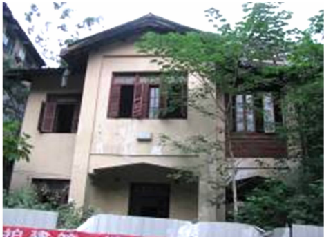
图 19 福州市城直街 31 号立面形式 Fig. 19 Elevation of No. 33 Chengzhi Street in Fuzhou