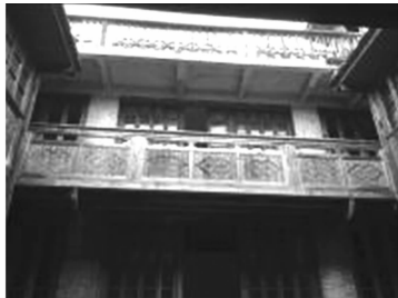
图 3 福州市下杭路 209 号局部空间置换 Fig. 3 Part spatial displacement of No. 209 Xiahang Road in Fuzhou

在传统民居建筑中,固然有许多精华的东西,但也有许多与现代生活格格不入的问题.传统民居较多地体现封建的伦理道德,也是维护封建社会礼制的工具,其森严的等级制度、严格的尊卑秩序和长幼思想,不能满足现代人对自由、平等生活的追求和向往.