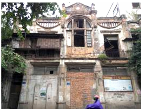
图 21 福州市下杭路 142 号立面图 Fig. 21 Elevation of No. 142 Xiahang Road in Fuzhou