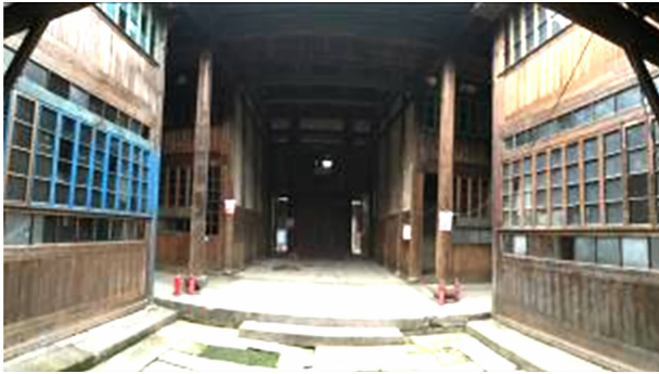
图 9 福州市下杭路 209 号厅井空间 Fig. 9 Space of hall and dooryard of No. 209 Xiahang Road in Fuzhou