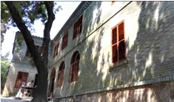
图 18 福州市马尾“圣教医院”立面开窗形式 Fig. 18 Elevation of window forms Christian hospital in Mawei, Fuzhou