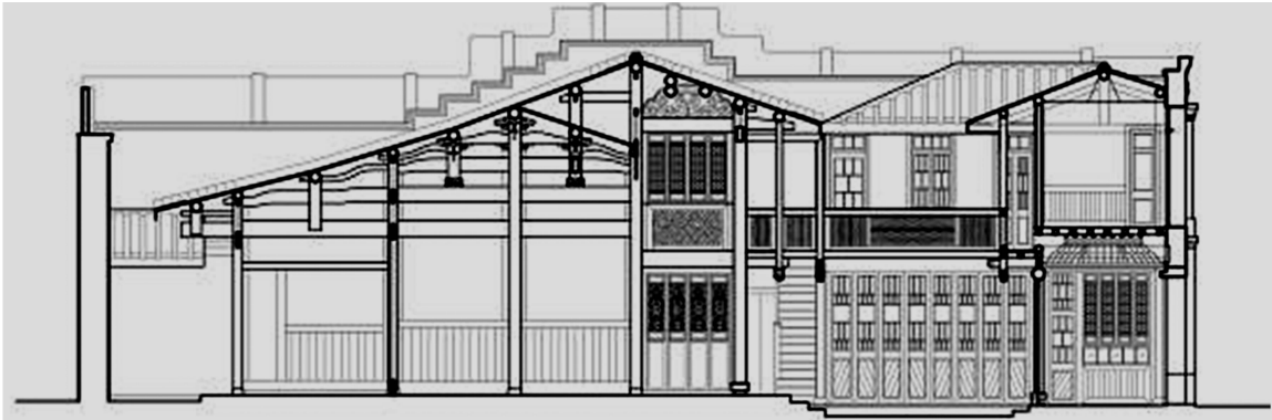
图 8 福州市中平路 186 号剖面图 Fig. 8 Profile of No. 186 Zhongping Road in Fuzhou