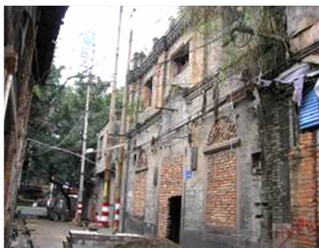
图 20 福州市上杭路 230 号立面图 Fig. 20 Elevation of No. 230 Shanghang Road in Fuzhou