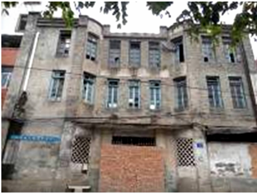
图 15 福州市下杭路 136 号立面图

同时,青砖材料被普遍推广使用(其中也有部分是红砖)(图 15,16),以及三角形木屋架形式设计日趋规范,使砖木混合结构形式成为福州民居转型期建筑结构演进的主流。