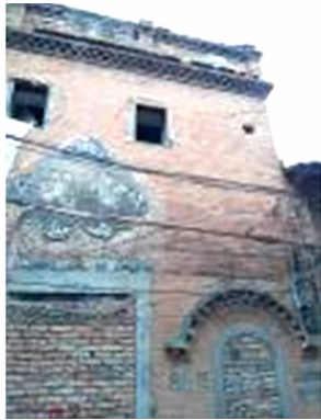
图 16 福州市上杭路 180 号立面图