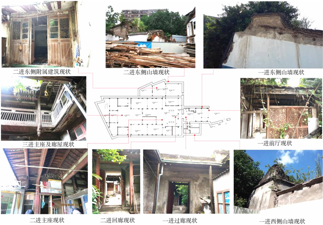
图 4 福州市城直街 33 号平面布局现状解析

民国时期福州民居在空间布局形式的演进主要表现在形制与层数的变化上。 2.1.1 形制的变化 诸多中西合璧的“民国建筑”是穿插在传统民居大厝中的局部建造或改造,将外来建筑融入到固有的空间秩序中,往往在一组院落中拆掉一部分,把原有的传统“置换”成西式洋楼(民国建筑),这种做法受到传统民居形制的严格制约,违反了这一传统空间形制与风水禁忌,会被认为是“破格”即“不合規制”而不能被采用。局部洋楼由于藏于传统民居的合院之中,故西化的象征意义又表现得较为含蓄,从民居平面布局看,一般仍有明显的主从关系,旧厝为主,洋楼为辅(图 4)。福州三坊七巷和上、下杭的传统民居中,多以局部置换或分家后局部增建洋楼,较少拆旧厝进行全面改建。