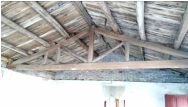
图 13 福州市马尾“圣教医院”三角屋架