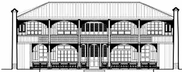
图 2 福州市陈绍镠故居立面图 Fig. 2 Elevation of CHEN Shaoqiang's former residence in Fuzhou