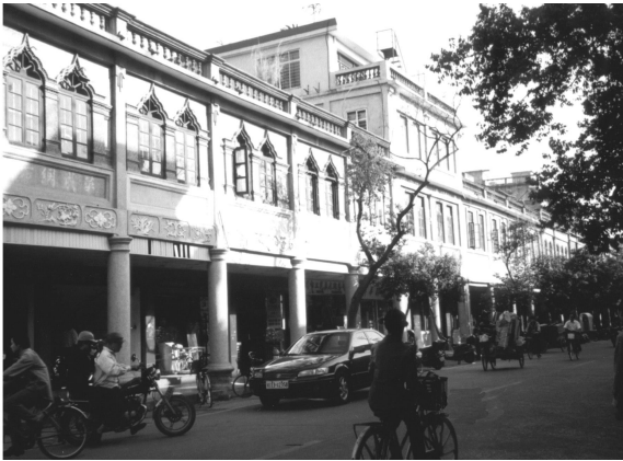
图1 泉州市中山路近代骑楼

泉州近代骑楼基本是由本地工匠来建造,这一时期,他们依然持有精湛的传统手工艺,保持着较高的创作热情和水准。他们在施工实践中学习西洋技术和装饰,并凭借自己的理解对西方建筑样式进行再创作。因而,近代骑楼呈现出亦中亦西、多元融合的折衷主义风格。近代骑楼在材料上结合了地域材料(砖和石)和当时的先进材料(洋灰和水刷石),都清水使用,以自然纹理显示。街道色彩以红白两色为主,间以水刷石之浅灰色,丰富而华美。其中,立面窗、窗间墙、壁柱及墙的组合,是骑楼形式表征的重点。窗与窗的组合以各式精美的大小柱式来连接,组合随意又自然。窗间墙嵌以浅浮雕的中、西式花纹和文字,处处透露出工艺的智慧和对整体构图比例的适度把握。细致线角赋予立面精致感,充满人情味。在“柱墙身-女儿墙”的三段式构图之中,产生出协调而又异化的特质。图1是位于泉州市中山路的典型近代骑楼。泉州古城区的当代骑楼,大致可分为两类。一类采用较多的地域元素,如新门街、涂门街和东街;另一类采用很少或基本不采用地域元素,如湖心街。其中地域元素化的当代骑楼在泉州城区居于主要地位,是本文的比较对象。泉州当代骑楼在形式上,摘取传统民居中的符号和片断来应用,表现出对本土形式(古民居屋顶、山墙、各式窗形等)及本土材料的模仿(仿燕尾砖与石材之组合等),缺乏细部和整体比例的推敲。虽然,它们作了很多体量上的变化,但由于骑楼街内单体风格变化少,没有出现近代骑楼单间组合的情况,有着单一、模仿和同化的特点。图2是位于泉州市新门街的典型当代骑楼。