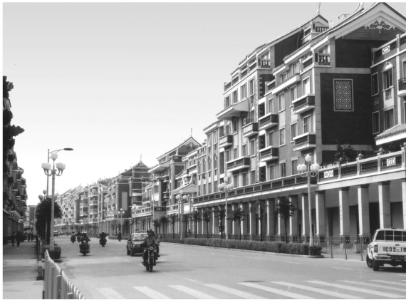
图2 泉州市新门街当代骑楼

芦原义信认为,决定建筑本来外观的建筑临街外墙面为建筑的“第一次轮廓线”,建筑外墙的凸出物和临时附加物所构成的形态称为建筑的“第二次轮廓线”。“第二次轮廓线”的无秩序和非结构化的“含糊轮廓”,会影响第一次轮廓线的表达,形成混乱的街景 [3] 。在经济利益驱动下,当代城市街道立面常常淹没在无规划的商业广告招牌中。骑楼街则往往能形成较完整的第一次轮廓线。究其原因是,骑楼的柱廊、窗下和列柱等建筑部位为广告招牌的设置留出了统一的空间,使得立面生气盎然而不杂乱。相比较于未设骑楼商业街,泉州近代与当代骑楼第一次轮廓线的表达完整,这是新、旧骑楼街的共同特点。