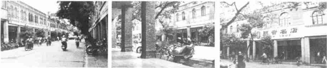
(a) 远景 (b) 中景 (c) 近景

还表现在空间和质感上。古代工匠经验性的建筑活动, 是在类似试错法下逐步完善的, 它是一种逐步的、 动态的过程。它可以使建筑在不断调整过程中逐步完善, 在不经意间达到完美的地步。泉州特有的胭脂 砖, 其质地优良、色彩华丽, 具有很强的表现力, 特别适合于这种小尺度街道。从远、中、近3个层次来观 察泉州中山路街道的沿街建筑, 它明显地以线的划分和类似的比例来统一街道尺度, 强调它的亲切宜人 的气氛。随着人与沿街建筑观察距离的逐渐缩小, 其绝对尺度呈逐渐递减, 始终可以感觉到类似的尺度。 它从整体到局部, 不论街道、骑楼、开间、窗, 比例都接近黄金比例。这是巧合, 也是必然(图3)。