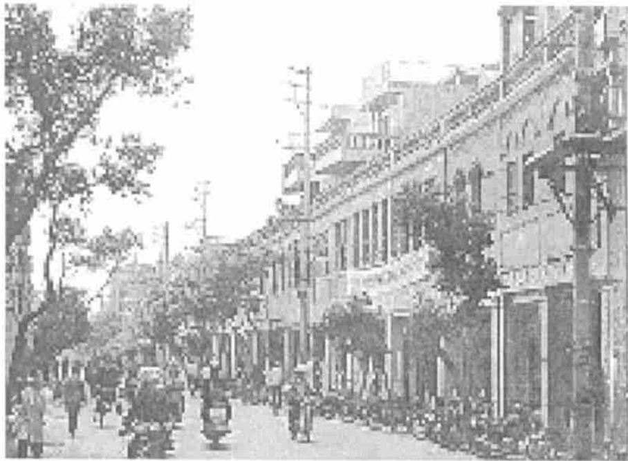
图3 泉州中山路街景

是各个场所中所发生的人的活动而不是容纳这些活动的建筑空间本身.由此我们不难理解为什么在暮阳夕下时,人们喜欢端着饭碗在家门口吃饭的生活情景.所以,我们认为泉州中山路之所以能够吸引人,保持其活力并不是由于那些精美的建筑,而是其生气勃勃的人的活动(图3).正如卞之琳在《断章》中写的“你在桥上看风景,看风景的人在楼上看你”.这些活动并以其历史的延续性,让人们感到了场所的归属感.在这里作为特定地域气候条件下,容纳人的活动的骑楼其意义得到了升华.骑楼建筑以其底层开敞性空间与泉州当地气候条件相适应,因为这里冬无严寒,春无沙尘,沿街店铺不需北方常见的封闭式门面处理.当有顶的公共走道