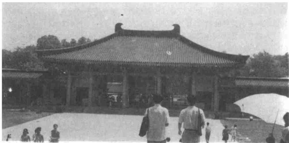
图1 陕西省历史博物馆

甲午海战馆依山傍海,滨临海战区域,从威海市区远望刘公岛,隐约可见一组气势磅礴的建筑群体.它犹如一位指挥作战的将领,深沉地凝望着暴风雨前夕的海面.其设计者采用象征